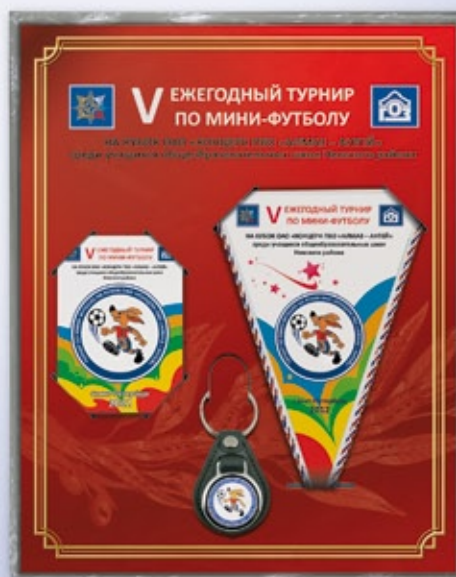
NB24 27x21,5 см тираж от 45 штук — <BU>