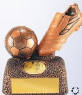
PS801 9 см —В <BR> ФУТБОЛ