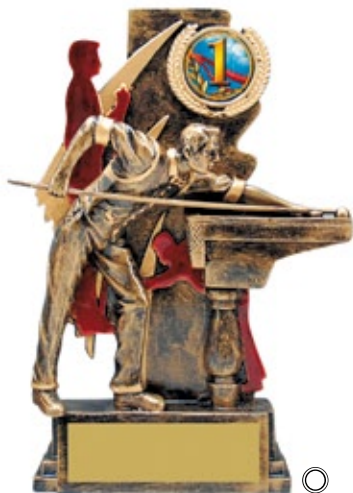
PS808 20 см —В <CB> БИЛЬЯРД