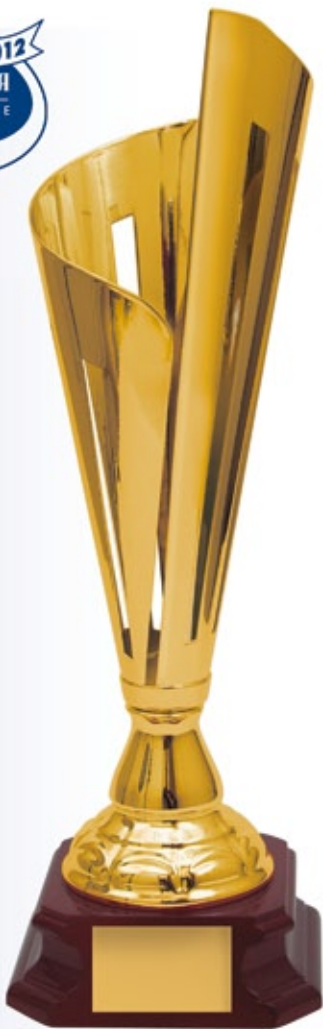
KM1203a 43 см <CY> KM1203b 38 см <CX> KM1203c 34 см <CW>