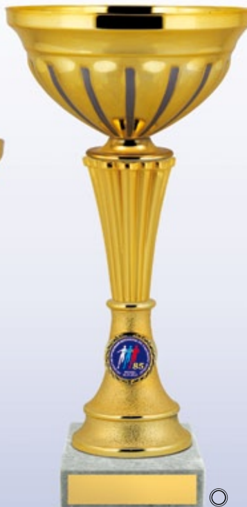
KM1201a 31,5 см —B <CE> KM1201b 27 см —B <BZ> KM1201c 23,5 см —B <BV>