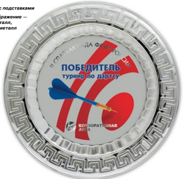
PS785a Ø 28,5 см <DB> PS785b Ø 22,5 см <CV> PS785c Ø 17,5 см <CM> полноцветное нанесение и гравировка