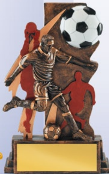
PS800 18 см <BV> ФУТБОЛ