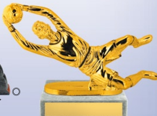
PS798 14 см <BS> ФУТБОЛ