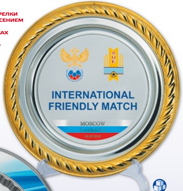
PS784a Ø 28,5 см <DD> PS784b Ø 22,5 см <CX> PS784c Ø 17,5 см <CO> полноцветное нанесение и гравировка