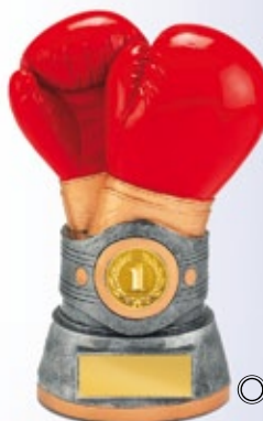
PS803 18 см —В <BW> БОКС