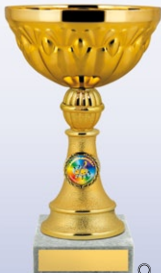
KM1202a 21,5 см —B <BT> KM1202b 19,5 см —B <BR> KM1202c 15,5 см —B <BP>