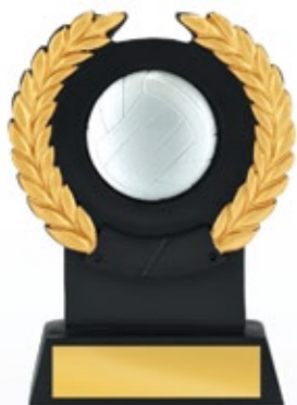
PS806 13 см <BU> ВОЛЕЙБОЛ