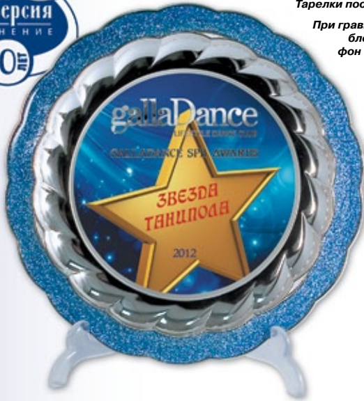
PS787 Ø 22,5 см <DA> полноцветное нанесение и гравировка

При гравировке изображение — блестящий металл, фон — матовый металл