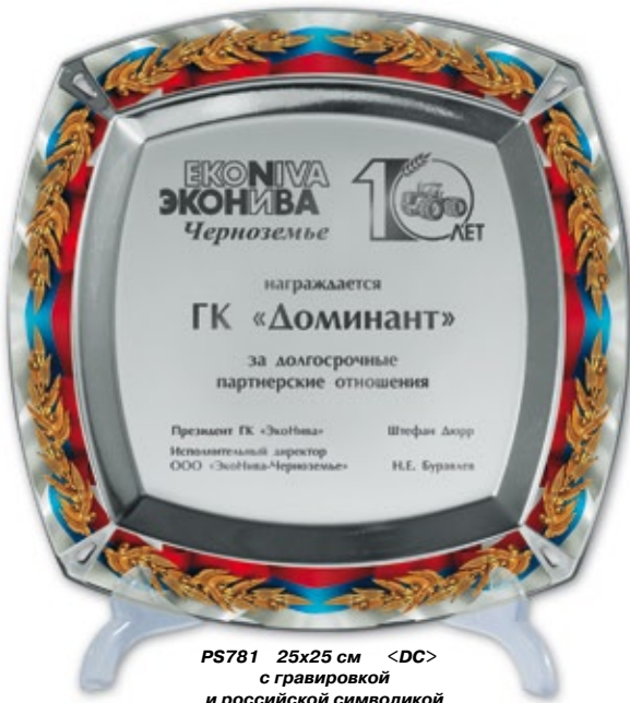
PS781 25x25 см <DC> с гравировкой и российской символикой на ободке