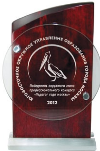
PS813 22,5 см <DB> дерево, металл, стекло