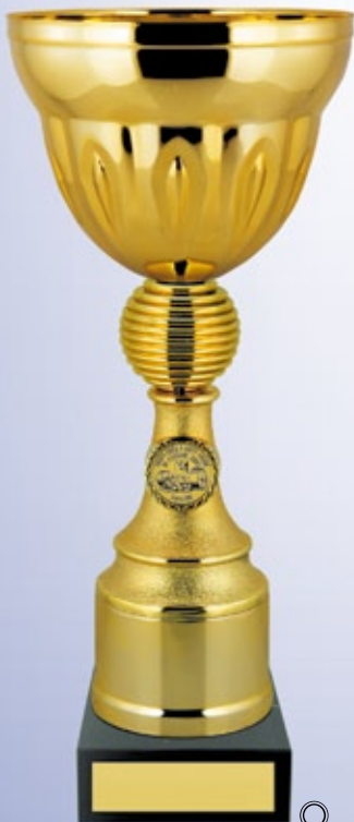
KM1200a 32,5 см —B <CF> KM1200b 29 см —B <CB> KM1200c 23 см —B <BV>