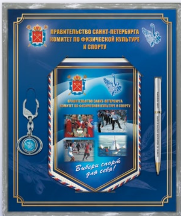
NB23 30x25 см тираж от 50 до 100 штук — <CB> тираж от 101 штуки — <BZ>