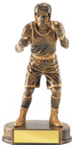
PS804 22 см <CD> БОКС