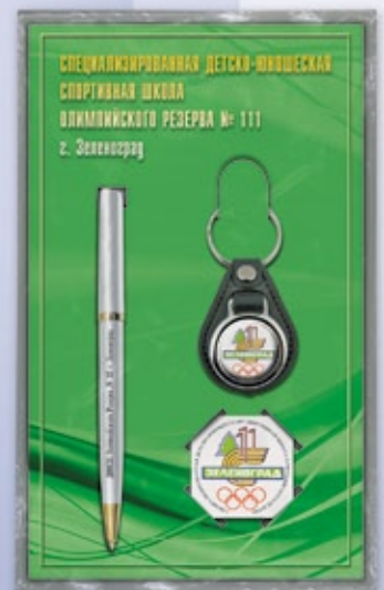
NB25 21,5x13 см тираж от 50 до 100 штук — <BT> тираж от 101 штуки — <BR>