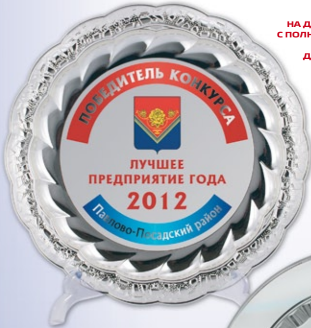
PS782a Ø 28,5 см <DC> PS782b Ø 17,5 см <CN> полноцветное нанесение и гравировка

ЦЕНЫ НА ДЕКОРАТИВНЫЕ ТАРЕЛКИ С ПОЛНОЦВЕТНЫМ НАНЕСЕНИЕМ И ГРАВИРОВКОЙ ДЕЙСТВУЮТ В РАМКАХ КАТАЛОГА «НОВИНКИ 2012»