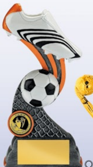
PS799 18 см —В <CC> ФУТБОЛ