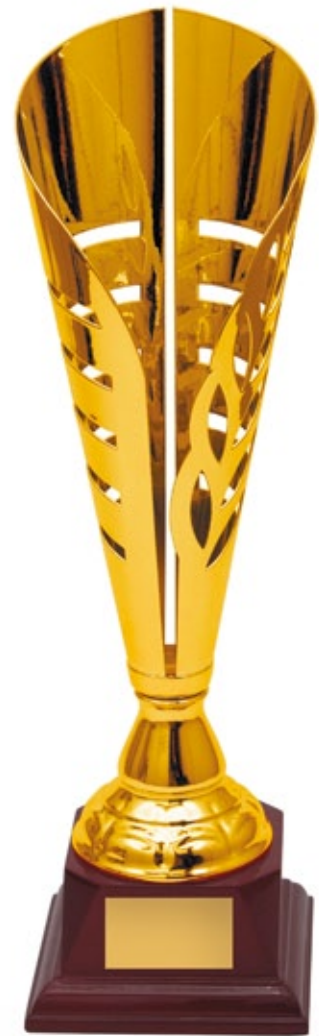
KM1204a 44,5 см <DA> KM1204b 40,5 см <CZ> KM1204c 36,5 см <CV>