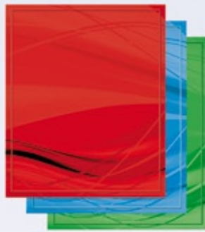
Стандартный дизайн подложки Вариант 2