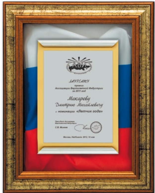
PS809 34x28,5 см <DA>