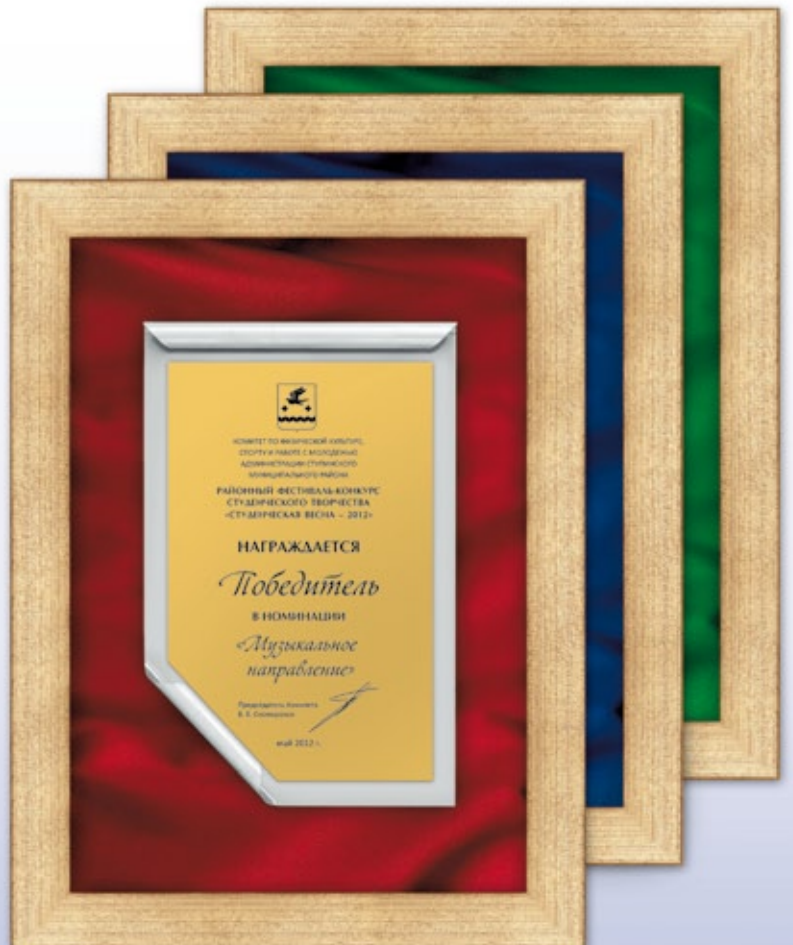
PS812a 31x25,5 см <CZ> — красный PS812b 31x25,5 см <CZ> — синий PS812c 31x25,5 см <CZ> — зеленый

Изделия с изображением гербов России, субъектов РФ, федеральных округов, муниципальных образований поставляются только покупателям, имеющим право на использование гербов в соответствии с нормативно-правовыми актами.