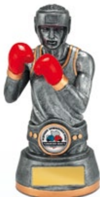
PS802 18 см —В <CF> БОКС