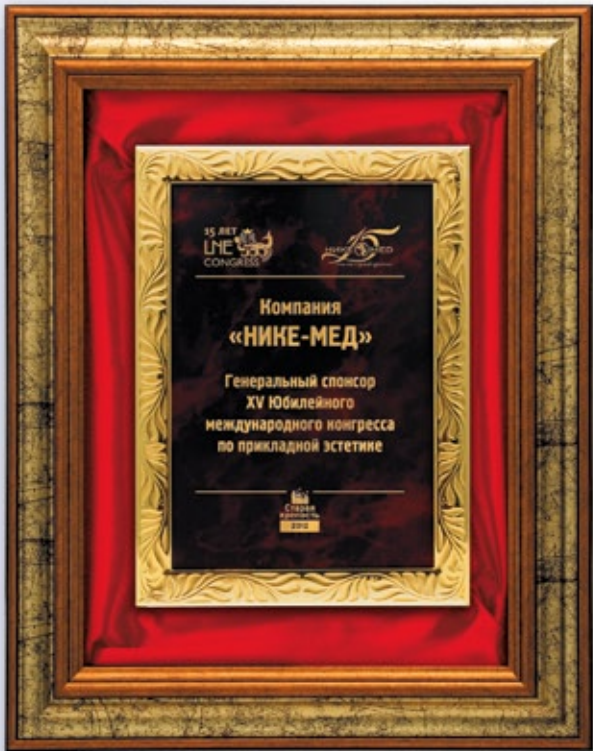
PS810 34x28,5 см <CZ>