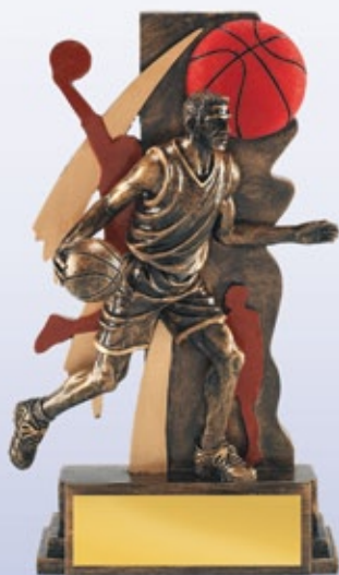
PS807 18 см <BZ> БАСКЕТБОЛ