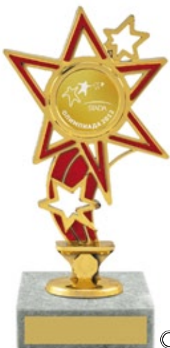
PS797a 19 см —В <BO> PS797b 17 см —В <BN> PS797c 14 см —В <BM>