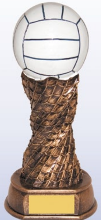
PS795 29 см <DF> ВОЛЕЙБОЛ