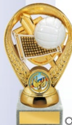
PS814 15,5 см —В <BU> ВОЛЕЙБОЛ