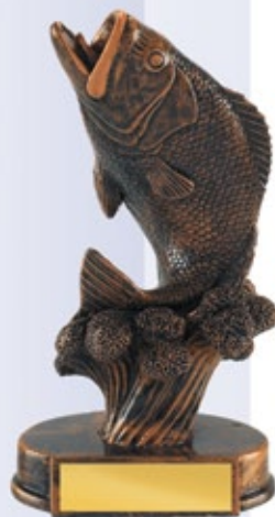
PS805 20 см <CE> РЫБА