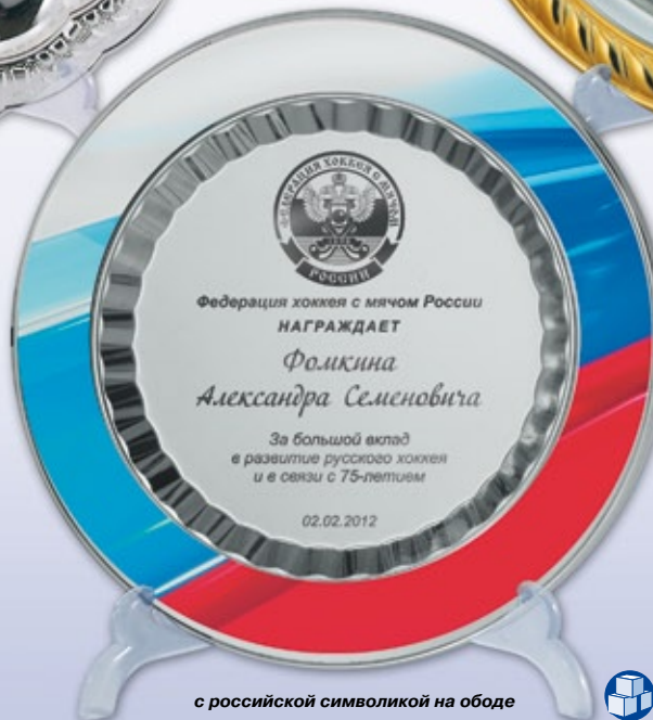
PS790a Ø 28,5 см <DD> PS790b Ø 22,5 см <CX> PS790c Ø 17,5 см <CO> полноцветное нанесение