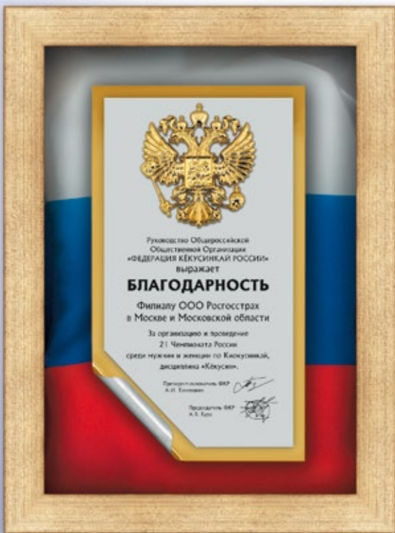
PS811 31x25,5 см <DA>