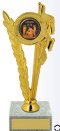
PS796 14,5 см —В <BH>